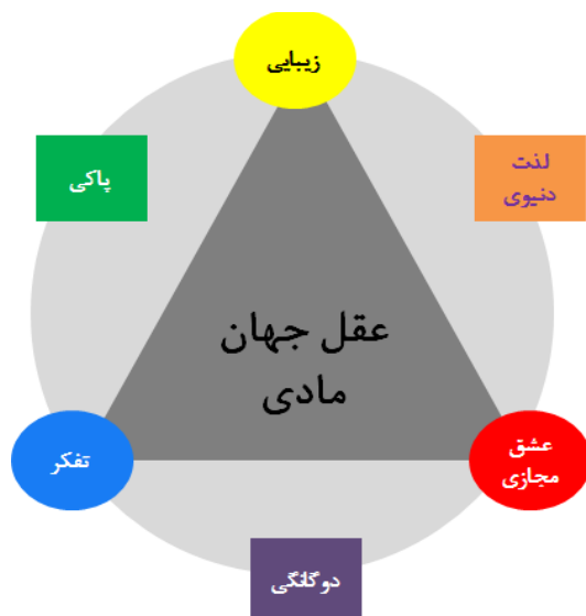
شکل (۱): ترکیبات رنگ: تمایلات مادی تا گرایش به معنویت به واسطه عقاید و باورها و علم روان‌شناسی (نویسندگان)