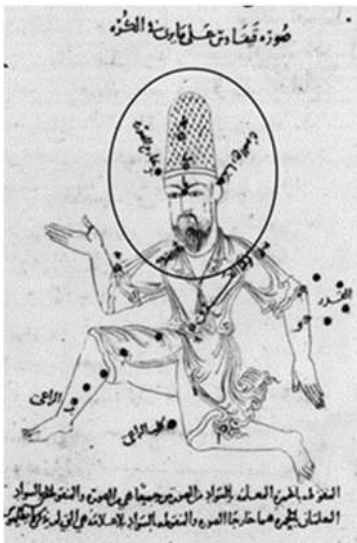
تصویر ۷ و ۸: صورت فلکی قیفاوس از نسخه خطی صورالکواکب عبدالرحمن صوفی