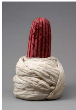
تصویر ۱۱: تاج ترک‌دار اهل تصوف