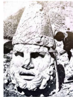
تصویر ۴: سردیس‌های نمرود داغ (گیرشمن، ۱۳۷۰: ۶۱-۶۳)

سرپوش‌های نوک‌تیز و قوائم اشکانیان نیز یادآور توصیف هردوت از سرپوش سکاهاست که «کورباسیا» به معنی محافظ گردن بوده است. شواهد نشان می‌دهد که این سرپوش به لحاظ ظاهری متغیر و دارای حداقل دو گونه شناخته شده بر اساس ارتفاع بوده است (نک: افکنده و افشاری، ۱۳۹۸: ۳۴-۳۹). در طول قرن اول کلاه‌های نوک‌تیز رایج در نمرود داغ و نمونه‌های پارتی به صورت کلاه‌های بلند و گرد شده رواج داشته است و در دوره ساسانی با کمی تغییر در نوک کلاه، به گردی گرایش پیدا کرد. کلاه‌ها و