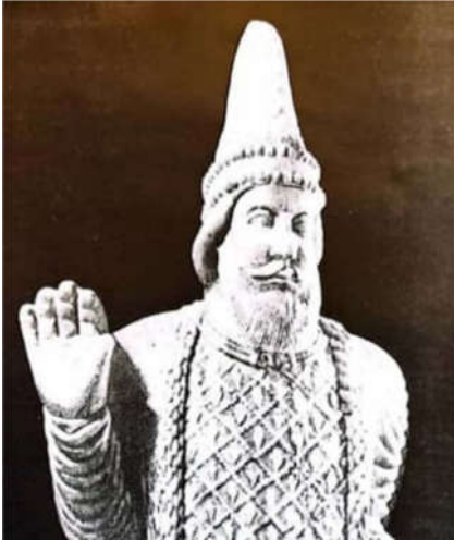
تصویر ۶: تندیس شاهزاده پارتی. بخشی از اثر (گیرشمن، ۱۳۷۰: ۸۹)

سرپوش‌های کشیده مینیاتورهای مانویان با نوک گرد در تورفان، یکی از شواهد مرتبط با این موضوع است. در میان سغدیان نیز کلاه‌های نوک‌تیز از رایج‌ترین اشکال سرپند مردان بود (نایمارک، ۱۳۸۳: ۱۲۳).