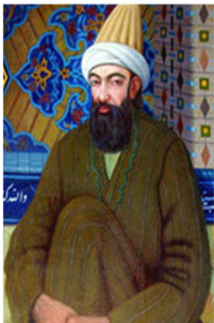
تصویر ۱۲: تصویری از شاه نعمت‌الله ولی با کلاه ترک‌دار صوفیه ( https://fa.wikipedia.org )