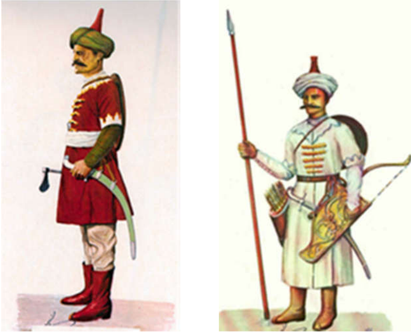
تصویر ۹: سرپوش قزلباش‌ها (ذکاء، ۱۳۵۰)

بسیاری از سفرنامه‌نویسان نیز از جمله دلاواله و اولثاریوس، به تاج دوره صفوی اشاره و آن را کلاه بی‌لبه قرمزی توصیف کرده‌اند که دوازده ترک به نشانه دوازده امام داشته است و به‌جز مواقع تشریفاتی به‌ندرت بر سر گذاشته می‌شد (دزی، ۱۳۸۳: ۶۷).