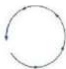
شکل ۳: طرح‌واره چرخه‌ای (Johnson, 1987: 120)

این طرح‌واره، یکی از اشکال طرح‌واره حرکتی است. «بقا و حفظ حیات ما انسان‌ها، وابسته به یک سری از فعالیت‌های مکرر و قاعده‌مند چرخه‌ای در بدنمان است؛ مانند ضربان قلب، تنفس، خواب و بیداری، گوارش و... بسیاری از پدیده‌های اطراف ما در جهان نیز به صورت چرخه‌ای رخ می‌دهند؛ مانند شب و روز، تغییر فصول، تولد و مرگ، رشد گیاهان و حیوانات. این چرخه با یک نقطه آغازین شروع می‌شود و یک توالی از حوادث مرتبط را طی می‌کند و در جایی که آغاز شده بود، به پایان می‌رسد تا چرخه جدیدی را از نو آغاز کند» (Ibid: 120). الگوی طرح‌واره‌ای یک چرخه به شکل زیر است: